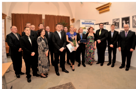
Víťazi jednotlivých kategórií ŠOS 2012/2013

Na slávnostné podujatie bude pozvaný víťazný študent spolu s dekanom/dekanou, resp. s riaditeľkou/riaditeľom externej vzdelávacej inštitúcie.