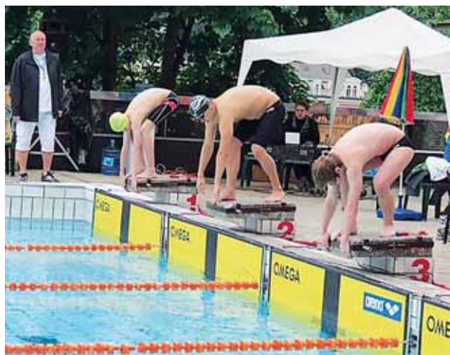
Tesne pred štartom

Oznamujeme všetkým, ktorí by chceli prispieť do ďalšieho čísla Spravodajcu UMB, že príspevky môžu posielat' elektronickou poštou na adresu simona.troiakova@umb.sk . Uzávierka príspevkov do ďalšieho čísla je 20. novembra 2013. Redakčná rada