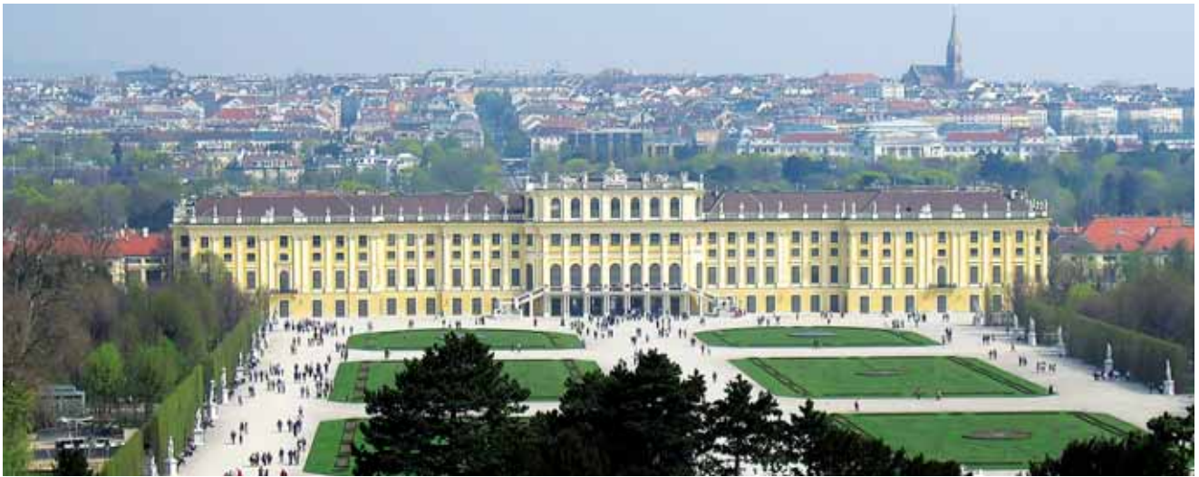
Pohľad na zámok Schönbrunn

vyzerá štúdium vonku. Tento program sa postará o váš komfort, zabezpečí vám prijatie na univerzitu, zadováži domáceho študenta, ktorý vás uvedie do života vášho nového životného priestoru, vybaví za vás väčšinu formalít a pomôže vám s nájdením vhodného ubytovania.