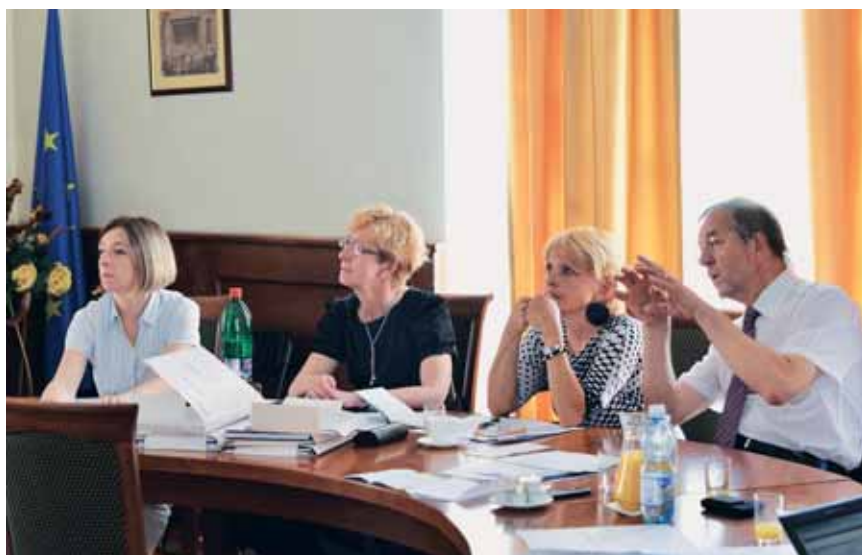
Obhajoba v Krakove

Fakulta humanitných vied UMB spoločne realizuje magisterské učiteľské štúdium nemeckého jazyka a literatúry s Univerzitou Friedricha Schillera v Jene, ktorej Filozofická fakulta zabezpečuje medzinárodne koncipované magisterské štúdium nemeckého jazyka ako cudzieho jazyka. Jenská univerzita má niekoľko desaťročí dlhú tradíciu takto zameraného