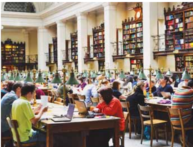
V univerzitnej študovni

vyzerá štúdium vonku. Tento program sa postará o váš komfort, zabezpečí vám prijatie na univerzitu, zadováži domáceho študenta, ktorý vás uvedie do života vášho nového životného priestoru, vybaví za vás väčšinu formalít a pomôže vám s nájdením vhodného ubytovania.