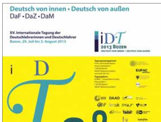
Logo kongresu v Bolzane 2013

Každé štyri roky si germanisti a učitelia nemčiny z celého sveta doprajú spoločné týždňové stretnutie v Európe – v niektorej z germanofónnych krajín alebo v zmiešaných regiónoch, kde má nemčina silnú tradíciu. Svetový kongres germanistov vždy ponúka mnohoraký program: ve-