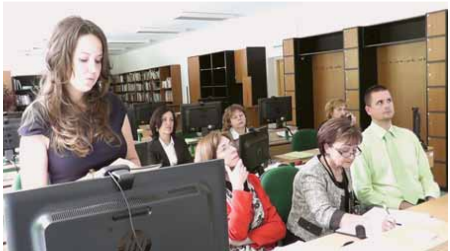
Obhajoba v Samovzdelávacom stredisku na EF UMB

Na základe dohôd o spoločnom zabezpečovaní študijných programov v cudzom jazyku sa uskutočňujú vzájomné výmenné