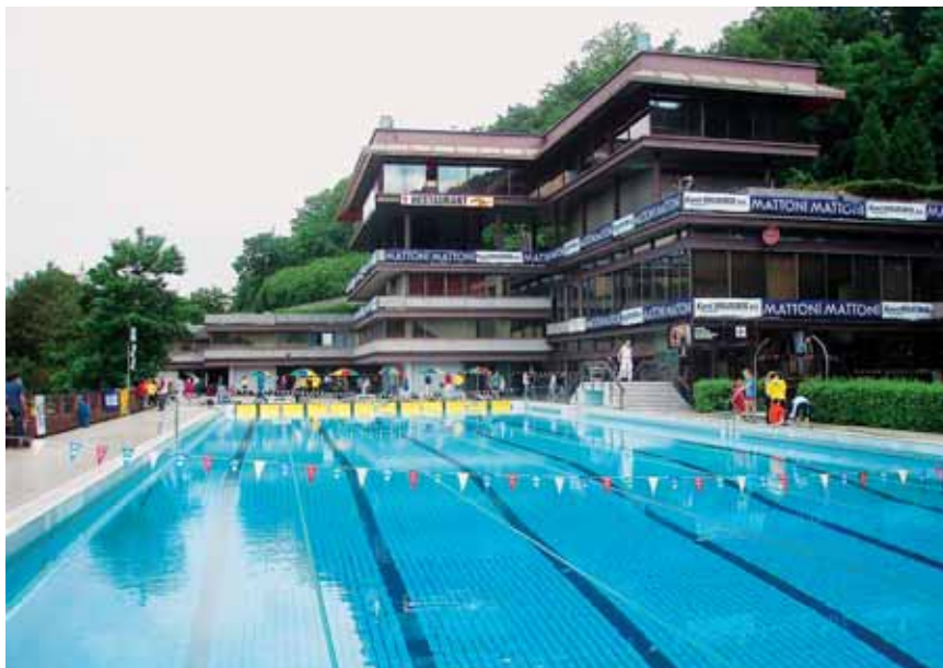
Bazén hotela Thermal

Svetoznáme české kúpeľné a festivalové mesto Karlove Vary bolo hosťiteľom 35. ročníka medzinárodných plaveckých pretekov Pohár karlovarského Vřídla . Hotelový komplex liečebného domu Thermal, v ktorom sa nachádza