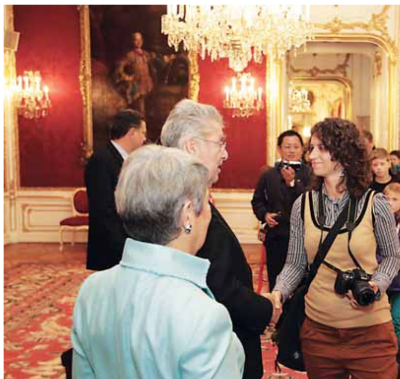
Na návšteve u prezidenta Rakúskej republiky Heinza Fischera