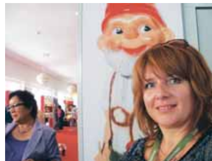
Na výstave učebníc nemčiny