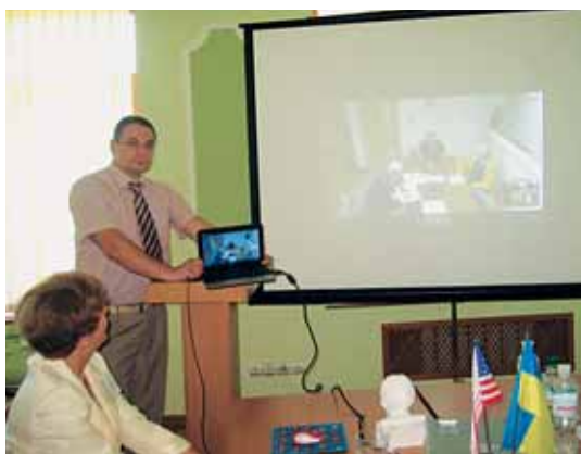
On-line diskusia s kolegami z Kansaskej štátnej univerzity, Manhattan, USA.